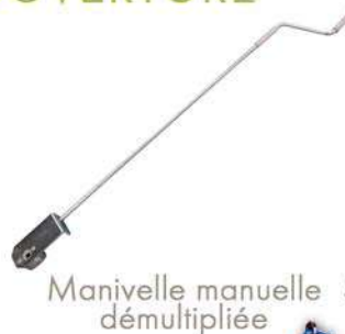
Manivelle manuelle démultipliée