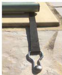
Sangles avec boucle